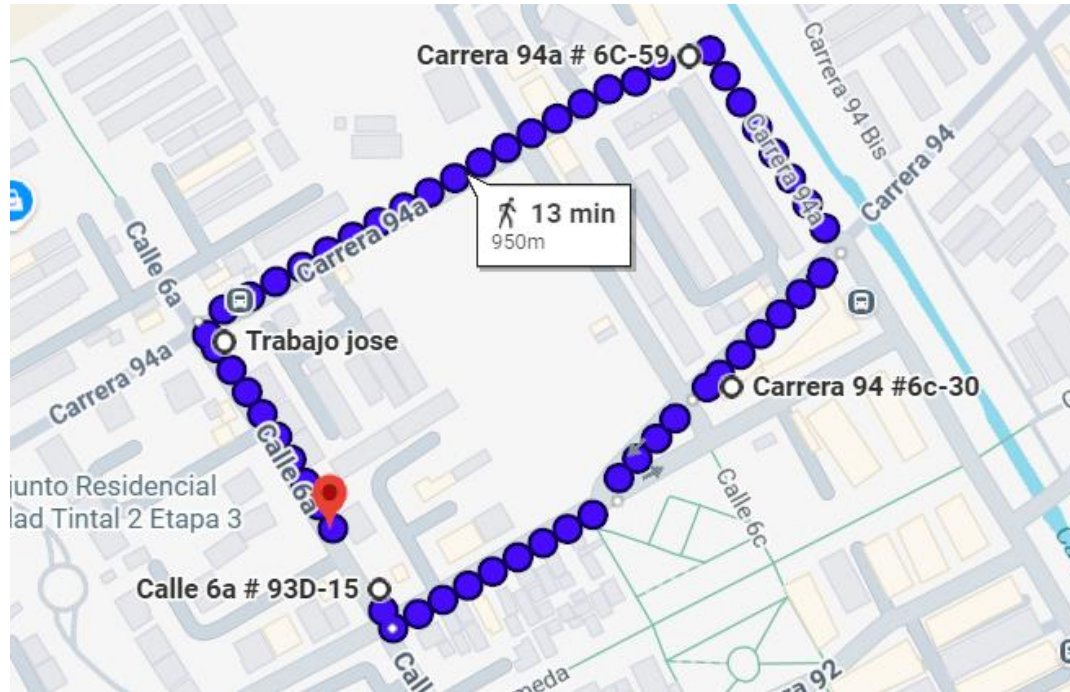
Imagen 1. https://maps.app.goo.gl/mSovqYfMYdqLh94K7

DESARROLLO: Una vez reunido el equipo calle del área Político – Jurídico de la alcaldía local de Kennedy se contactó al comandante del CAI Tintal para el inicio de la actividad, se priorizó la intervención en establecimientos de comercio identificados como puntos críticos o con alta recurrencia de quejas, con el fin de atender problemáticas previamente reportadas y mitigar impactos negativos en la comunidad